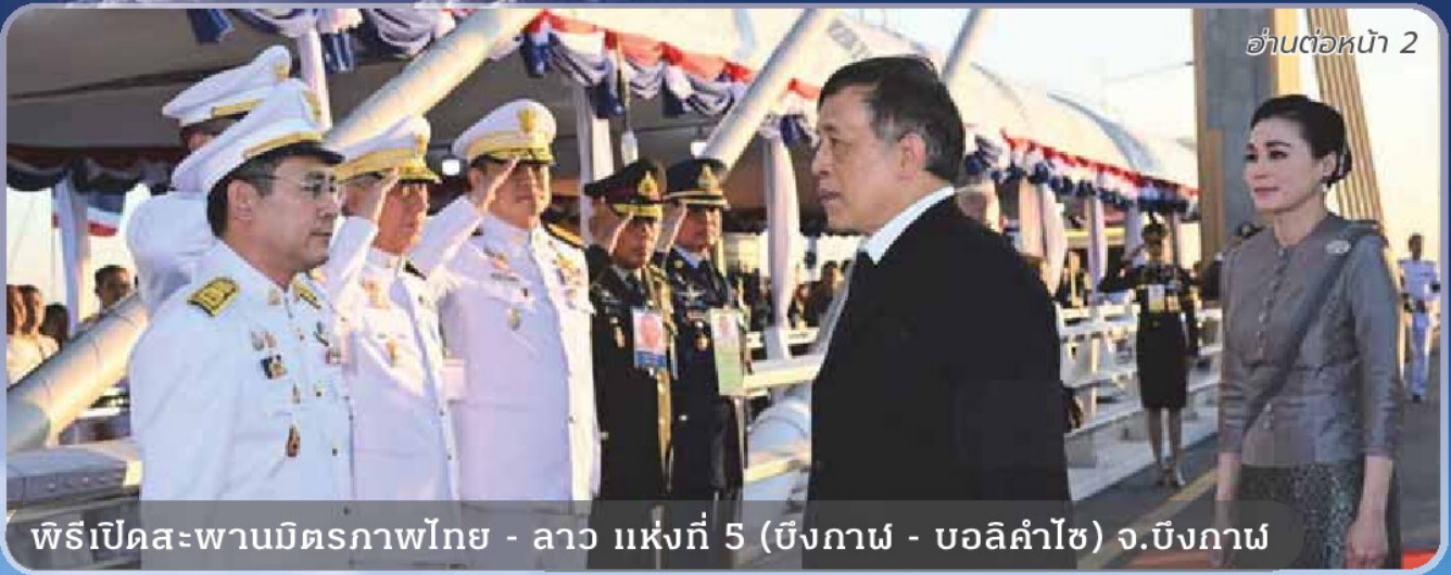
พิธีเปิดสะพานมิตรภาพไทย - ลาว แห่งที่ 5 (ชิงกาฬ - บอลิคำไซ) จ.บึงกาฬ

ตรวจเยี่ยมศูนย์บริหารจัดการจราจรและเส้นทางมอเตอร์เวย์ M6 ติดตามสภาพจราจรช่วงเทศกาลปีใหม่ 2569